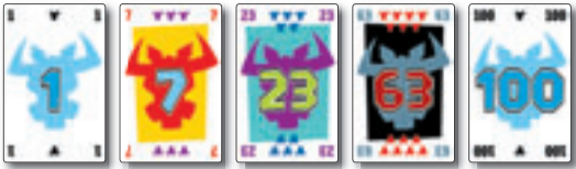
100 Hornochsenkarten mit Zahlen von 1 bis 100