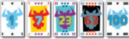
100 Hornochsenkarten mit Zahlen von 1 bis 100